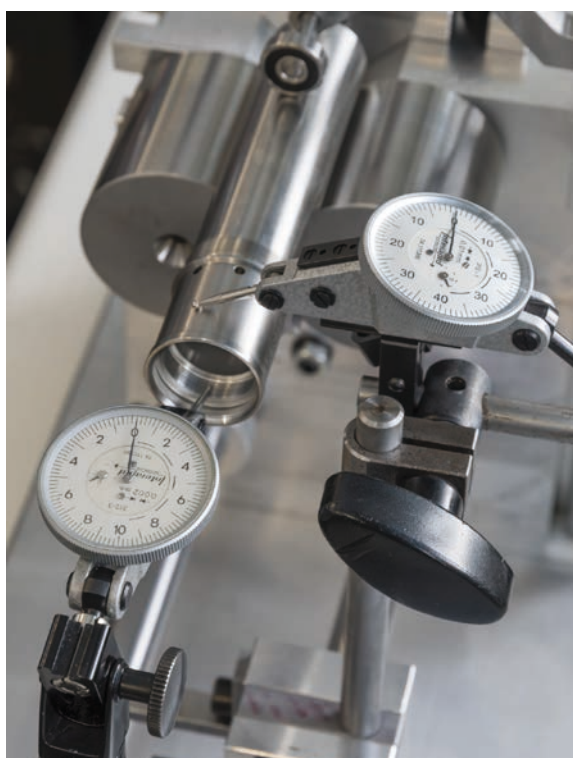
Mesure du battement radial d'une pièce montée sur un banc de mesure