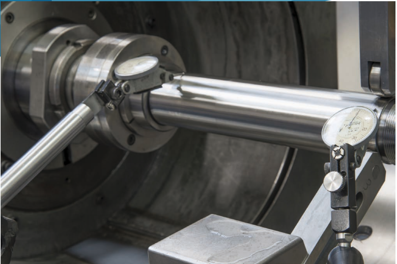
Contrôle avec deux TESA INTERAPID 312 pour positionner une pièce de révolution sur une rectifieuse