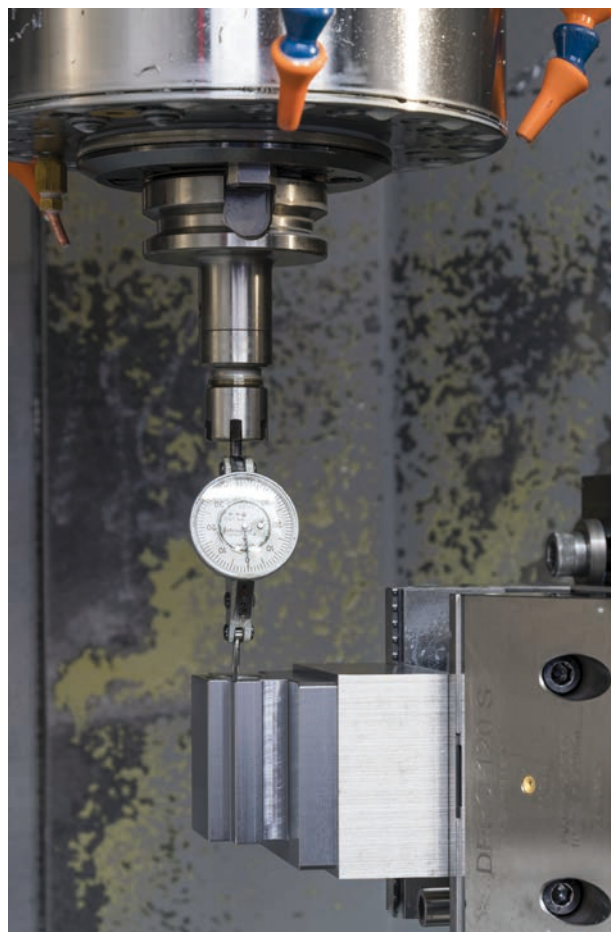
Le TESA INTERAPID permet la fixation sur la machine tout en mesurant la position de l'alésage. Pièce HRK 90 à positionner sur étau DERO 120S avec le TESA INTERAPID 312 dans le mandrin d'une fraiseuse.

“Malgré la modernisation des machines-outils, la recherche des points de référence par un indicateur à levier reste une solution simple et rapide, fortement appréciée par les opérateurs pour travailler en toute confiance dans les différentes étapes d'usinage”, affirme M. Degen.